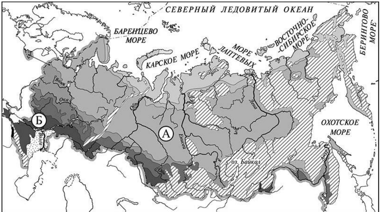
Приведена карта, используемая в учебниках на начало 2022/2023 учебного года.

3) Рассмотрни карту России. На ней буквами А и Б отмечены две природные зоны.