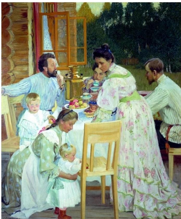
Борис Михайлович Кустодиев «На террасе»