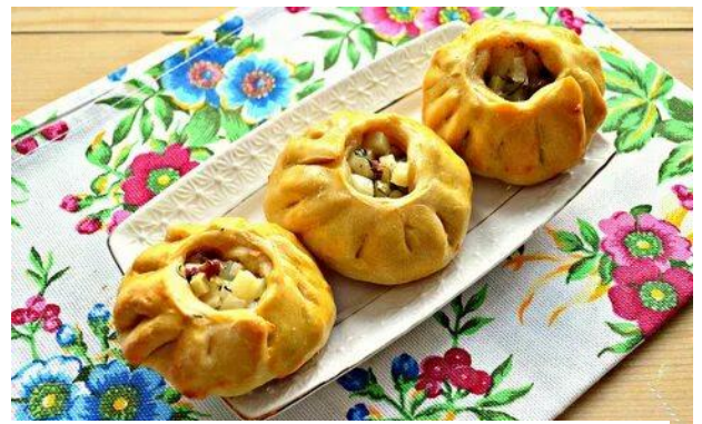
ВАК-БЕЛИШ (Республика Татарстан)