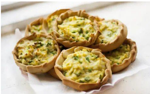
ПЕРЕПЕЧИ (Удмуртская Республика)

Учитель. Новогодние блюда народов России тоже имеют свои особенности. А сейчас я предлагаю вам посмотреть на блюда и угадать, в каком регионе России оно украшает новогодний стол.