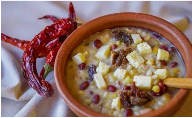
АШРАЙ (Республика Адыгея)