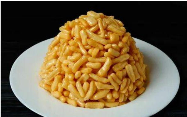
ЧАК-ЧАК (Республика Татарстан)