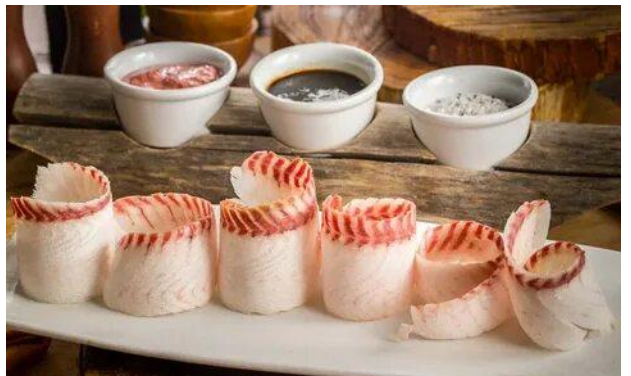
СТРОГАНИНА (Республика Саха (Якутия))