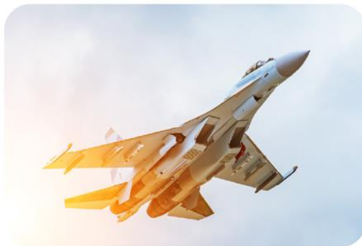
Военно-воздушные силы (ВВС)