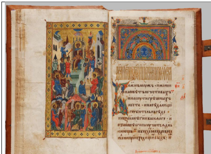
Из отдела рукописей и старопечатных книг Государственного исторического музея

Рассматривание страницы рукописной книги помогает обучающимся ответить на вопросы: «Почему говорят рукописная книга ? Что особенного можно заметить на страницах рукописной книги?»