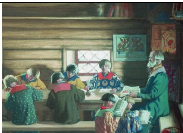
Б. Кустодиев «Земская школа в Московской Руси»

Книги окружают нас повсюду, а было время, когда привычных нам с вами печатных книг ещё не существовало. Очень-очень давно книг вообще не было, потом появились необычные для нас книги, их писали от руки, и не сразу на