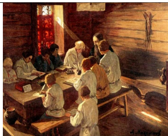
А. Максимов «Книжное научение»

Педагог сообщает, что иллюстрации помогут совершить путешествие в историю, и предлагает рассмотреть картины, обратить внимание на то, как выглядят ученики, у всех ли ребят есть книги.