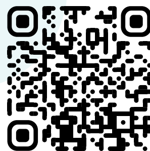
Телеграмм-канал для координаторов