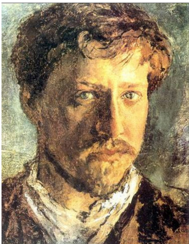
Автопортрет, В. А. Серов, 1880-е

Он отличался необыкновенной деликатностью по отношению ко всем, с кем приходил в соприкосновение; случайно обидев кого-нибудь, долго мучился от сознания причиненной другому неприятности, и тем не менее его боялись. Боялись и любили.