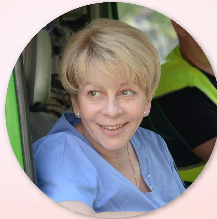
Доктор Лиза (Елизавета Петровна Глинка)

Человека, погруженного в душевную боль, надо крепко обнимать. И так сидеть, молча, тесно прижавшись, напрямую отдавая тепло, столько, сколько понадобится и насколько у вас хватит терпения и сил.