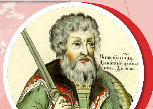
Князь Дмитрий Донской сборник «Корень Российских государей», 1672