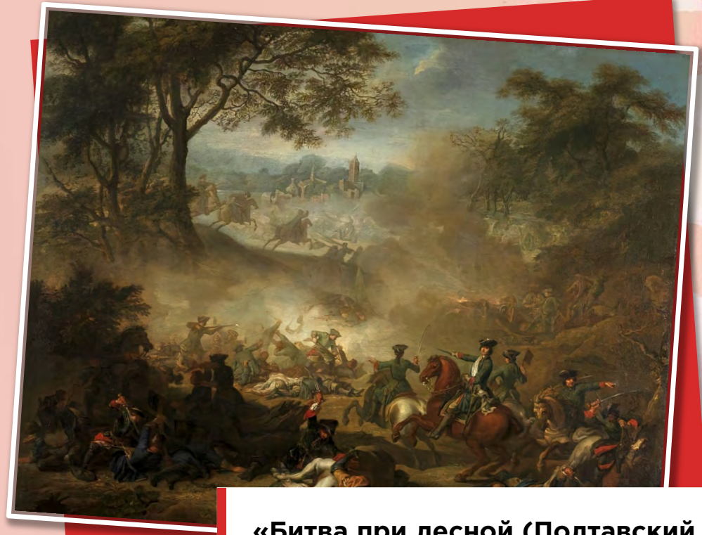
«Битва при лесной (Полтавский бой)» Жан Марк Наттье, 1717

10 июля — День победы русской армии под командованием Петра Первого над шведами в Полтавском сражении (1709 год)