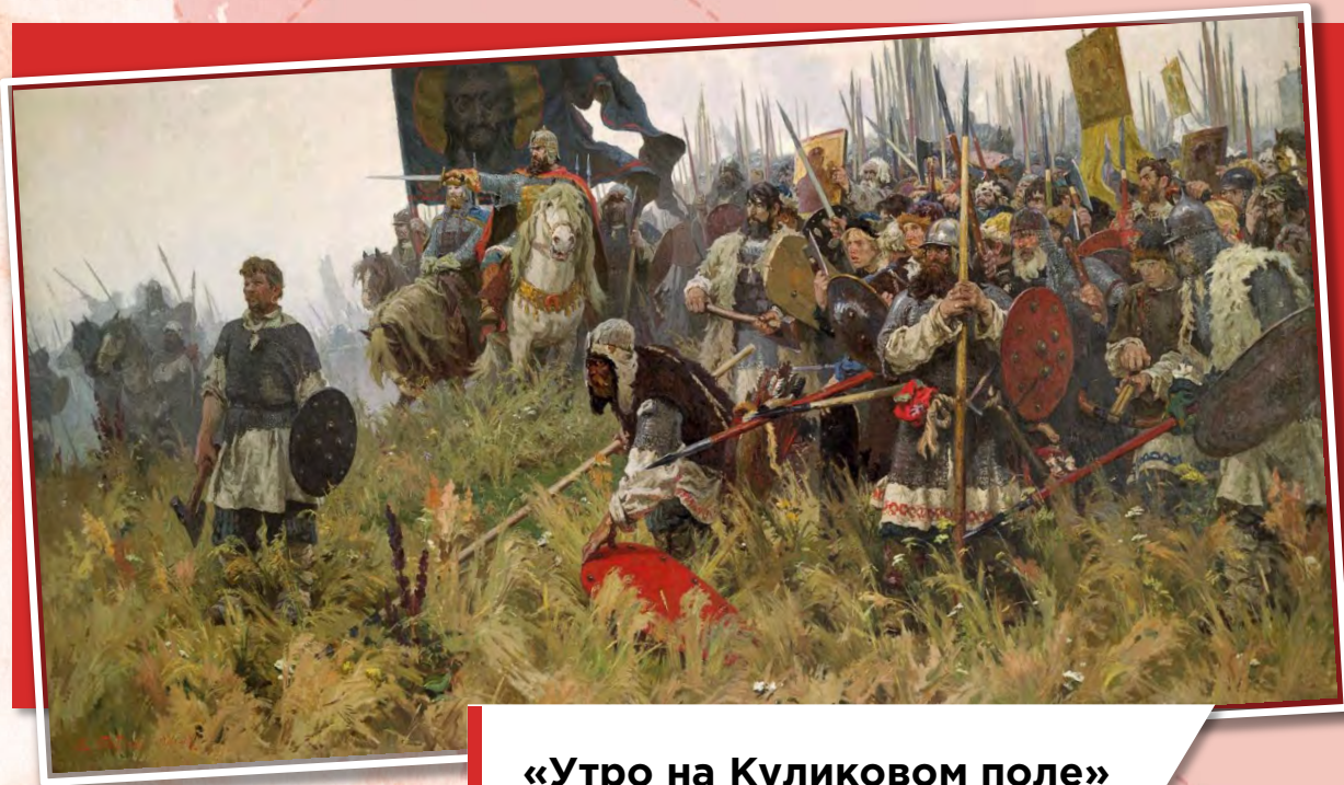
«Утро на Куликовом поле» Бубнов А. П., 1947

21 сентября — День победы русских полков во главе с великим князем Дмитрием Донским над монголо-татарскими войсками в Куликовской битве (1380 год)