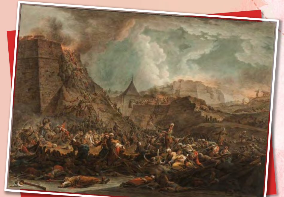
«Взятие Измаила (со стороны Дуная)» Иванов М. М., 1748

24 декабря — День взятия турецкой крепости Измаил русскими войсками под командованием А. В. Суворова (1790 год)