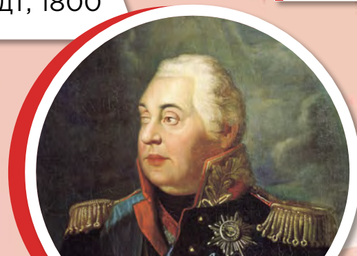
Портрет князя М.И. Кутузова Волков Р. М., XIX век