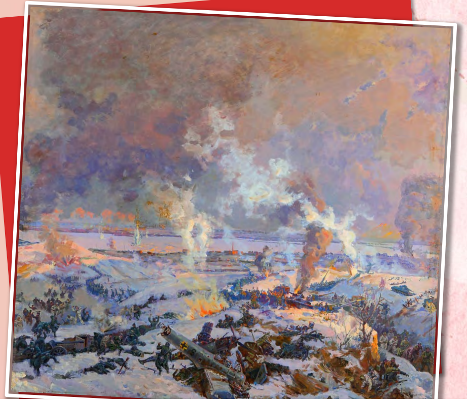
«Разгром гитлеровских войск под Сталинградом» Горпенко А. А., Опрышко Г. И., Радоман И. В., 1950

2 февраля — День разгрома советскими войсками немецко-фашистских войск в Сталинградской битве (1943 год)