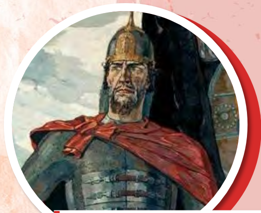
Александр Невский Корин П. Д., 1942