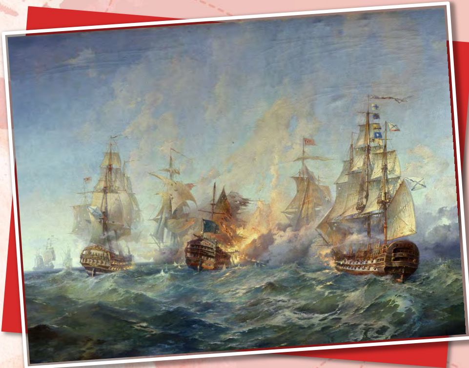
«Сражение у острова Тендра 28–29 августа 1790 г.» Блинков А. А., 1955

11 сентября — День победы русской эскадры под командованием Ф. Ф. Ушакова над турецкой эскадрой у мыса Тендра (1790 год)