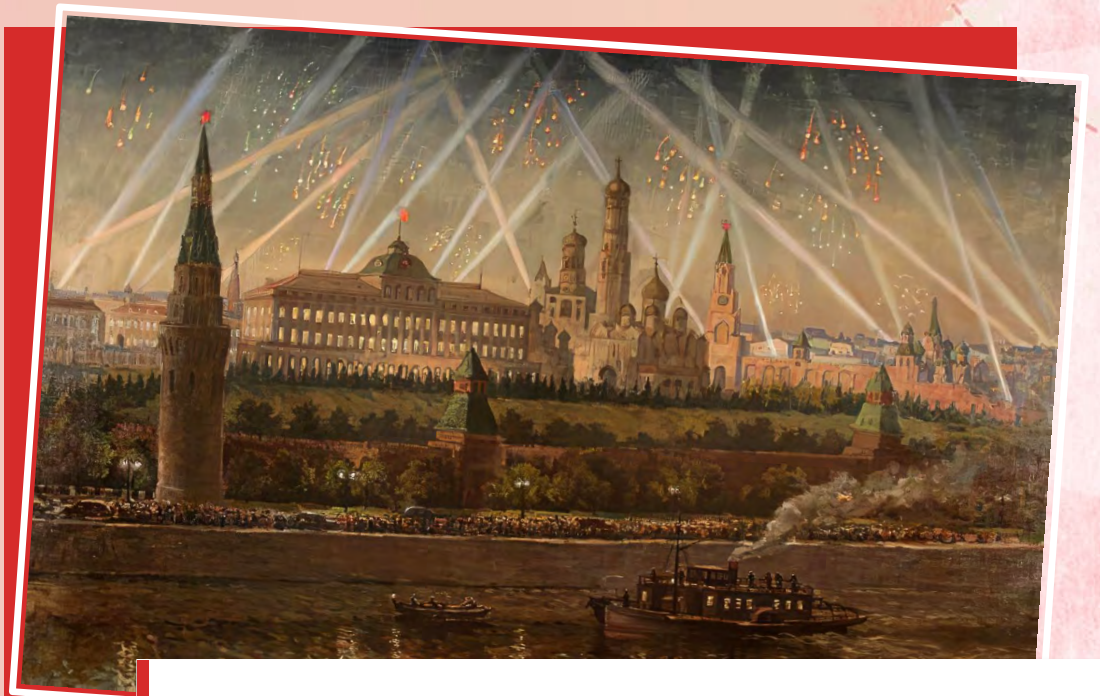
«Салют Победы 9 мая 1945 года в Москве» Голощапов Н. Н., 1945

9 мая — День Победы советского народа в Великой Отечественной войне 1941-1945 годов (1945 год)