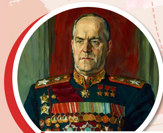
Портрет маршала Жукова Корин П. Д., 1945