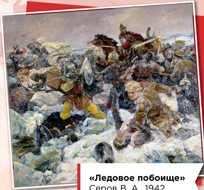
«Ледовое побоище» Серов В. А., 1942

18 апреля — День победы русских воинов князя Александра Невского над немецкими рыцарями на Чудском озере (Ледовое побоище, 1242 год)