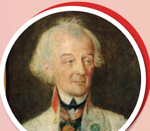
Портрет полководца Александра Васильевича Суворова Иоганн Генрих Шмидт, 1800