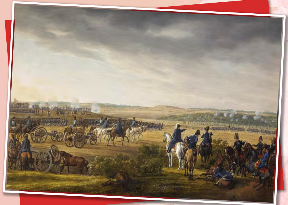
«Бородинское сражение» Альбрехт Адам, 1815

8 сентября — День Бородинского сражения русской армии под командованием М. И. Кутузова с французской армией (1812 год)