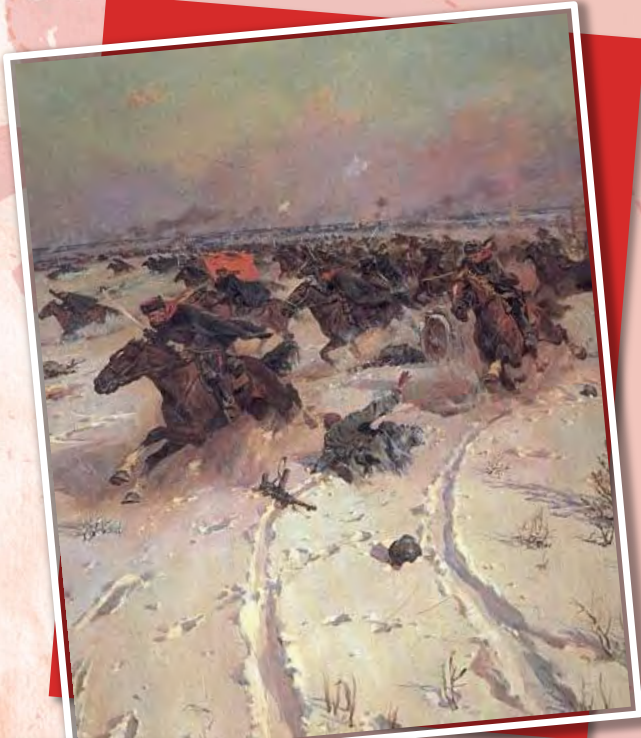
«Советская конница в боях под Москвой» Кривоногов П. А., 1950

5 декабря — День начала контрнаступления советских войск против немецко-фашистских войск в битве под Москвой (1941 год)