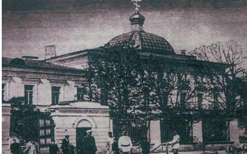
Псковская духовная семинария, где учился и преподавал Василий Беллавин

В детстве и юности будущего Патриарха звали Василий Беллавин. Он был сыном сельского священника из маленького городка Торопец, который находится недалеко от Пскова.