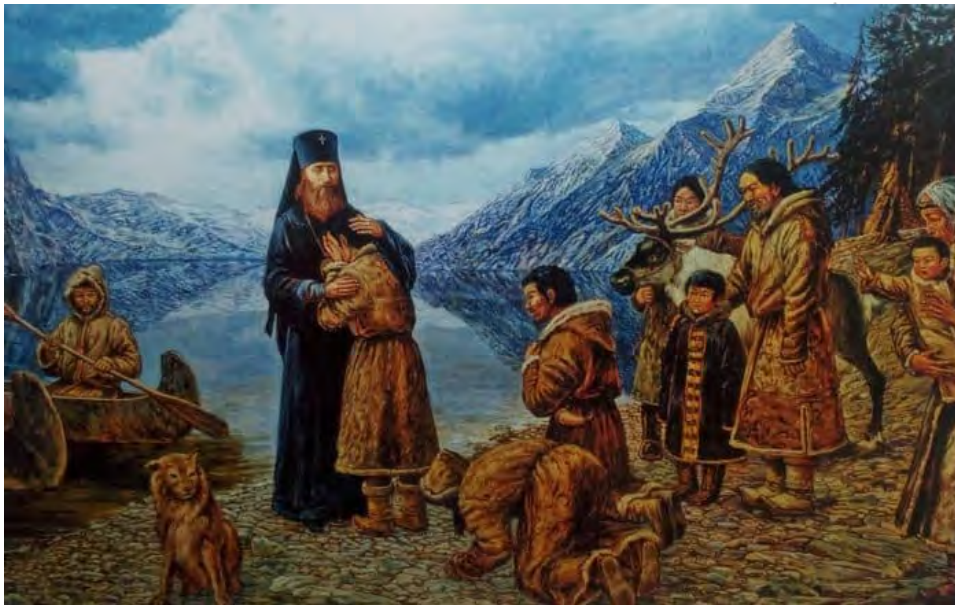
Будущий святитель Тихон на Аляске.

Пришло время, когда учитель Василий Беллавин решил уйти в монастырь, и всю оставшуюся жизнь посвятить Богу. Он стал монахом с новым именем Тихон. Вскоре его посвятили в епископы (высший священнический сан). Возросла его ответственность – теперь под его попечением были десятки церквей, а значит, тысячи православных людей.