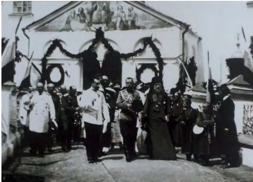
Император Николай II и архиепископ Тихон выходят из Успенского собора Ростовского кремля

Настало страшное время Гражданской войны: с оружием в руках пошел брат на брата, разрушались храмы, изгонялись священники. Безверие и страх завладели сердцами одних, жестокость и безумие – душами других. Поколебалась Святая Русь и совсем бы могла погибнуть, если бы не Патриарх Тихон, вставший на ее защиту.